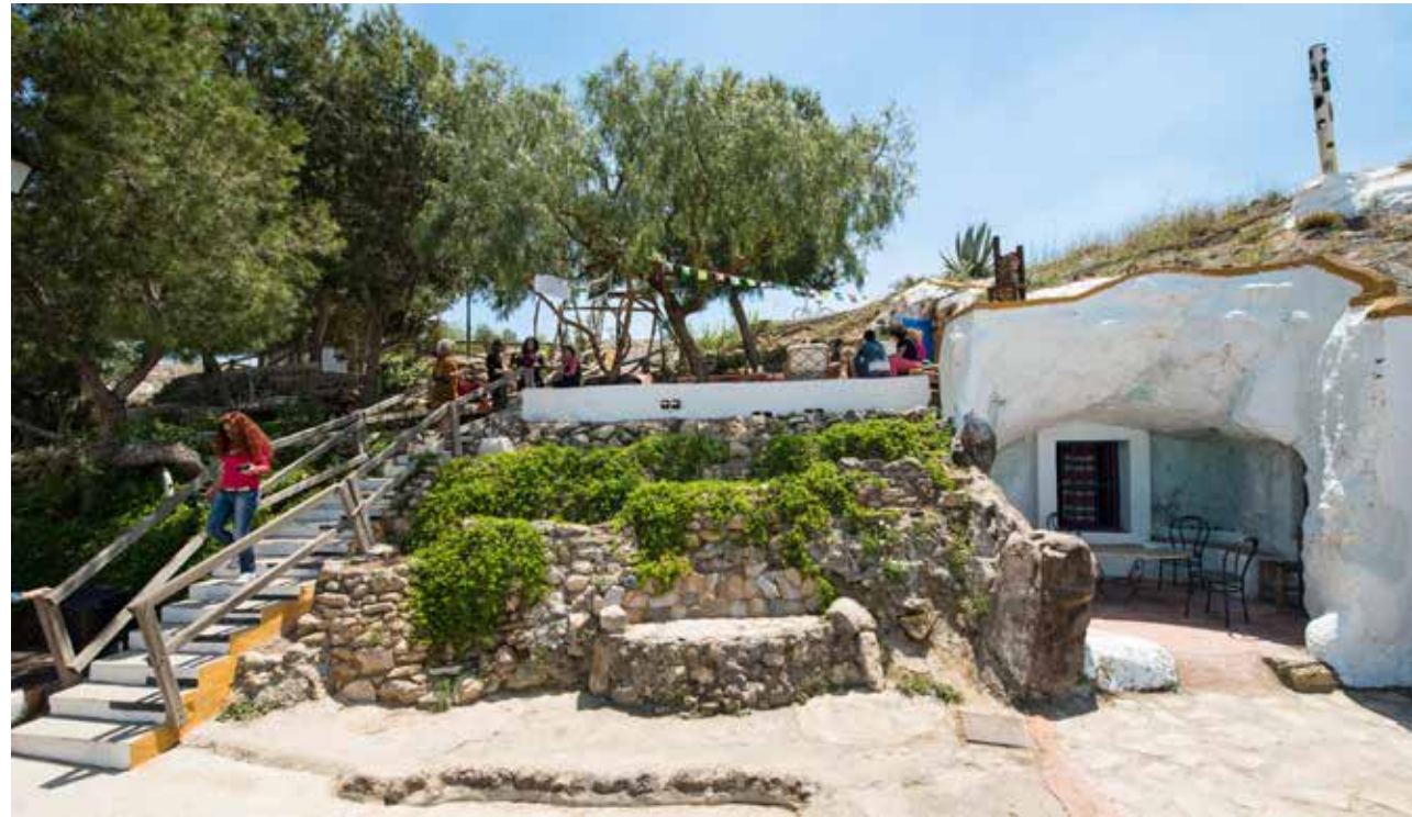
MERCADO DE ARTE Y ARTESANÍA

ES Este conjunto subterráneo le confiere la característica de poseer un casco antiguo irremplazable y, sin duda, de los más singulares de la Comunidad Valenciana.