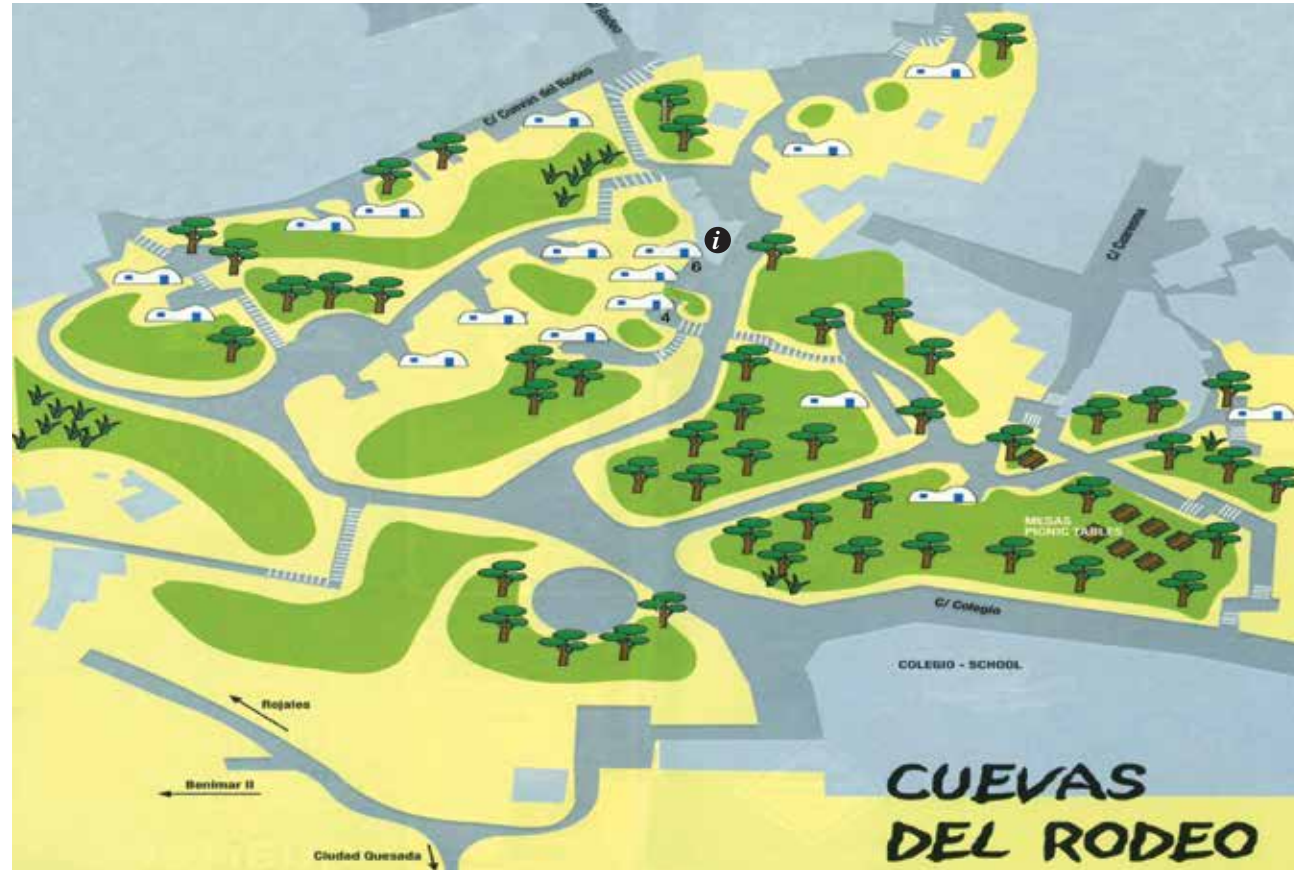
LOCALIZACIÓN DE LAS CUEVAS VISITABLES

ES La Cuevas nº 6 ha sido rehabilitada como Punto de Información Turística y la Cueva nº 4 como Sala de Exposiciones (Tel. 966 714 160)