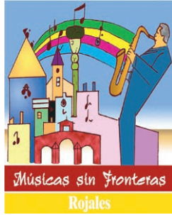
Músicas sin Fronteras Marzo - March