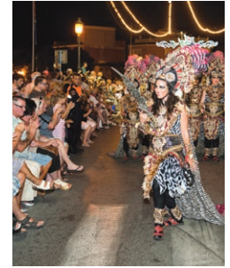
Fiestas de Moros y Cristianos en honor a San Pedro Junio/Julio - June/July