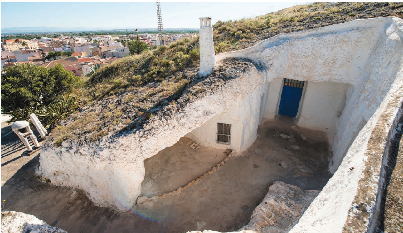
ECOMUSEO DEL HÁBITAT SUBTERRÁNEO MUNICIPAL Y ZOCO DEL BARRIO DEL RODEO

ES Las Cuevas del Rodeo son un complejo tradicional de viviendas excavadas en la roca entre los siglos XVIII-XX, actualmente rehabilitadas como cuevas-talleres artesanales y salas de exposición.