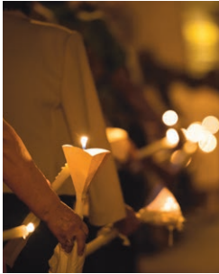
Fiestas en honor a San Roque y la Virgen del Rosario en Heredades Agosto - August