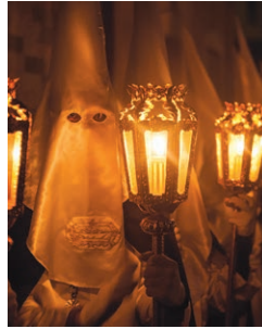
Semana Santa Marzo/Abril - March/April