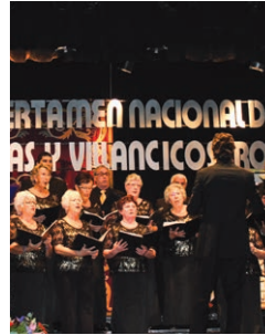
Certamen Nacional de Nanas y Villancicos Villa de Rojales Diciembre - December