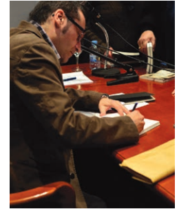
Presentación del Premio Novela Corta "Salvador García Aguilar" Diciembre - December