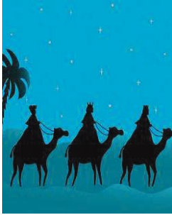
Cabalgata de Reyes Enero - January