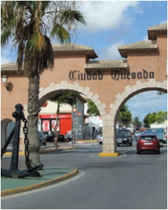
Fiestas en honor a San Justo de Ciudad Quesada Agosto - August