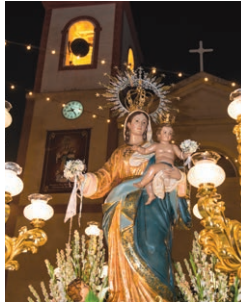
Fiestas en honor a la Virgen del Rosario Octubre - October