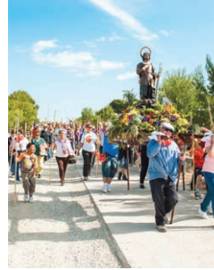
Romería de San Isidro Mayo - May