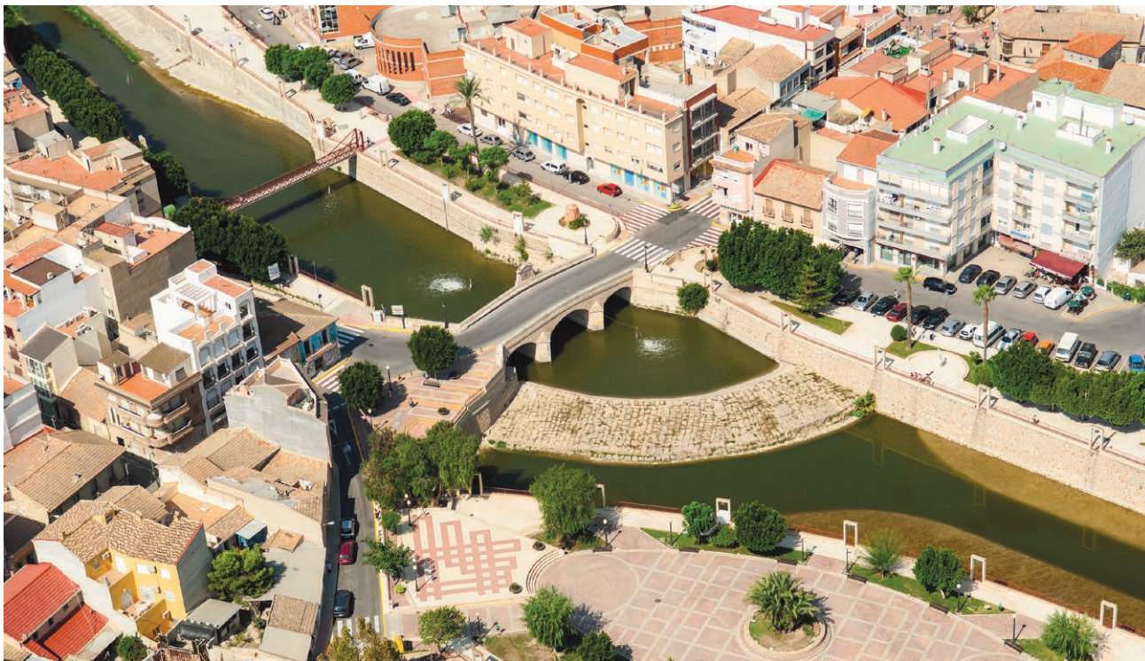
PUENTE CARLOS III, NORIA Y AZUD

ES Conjunto de monumentos de carácter histórico-artístico representado por el Azud, Boqueras de Acequia, Noria y Puente de sillería (siglos XVI-XVIII), constituyen un hito paisajístico y urbano.