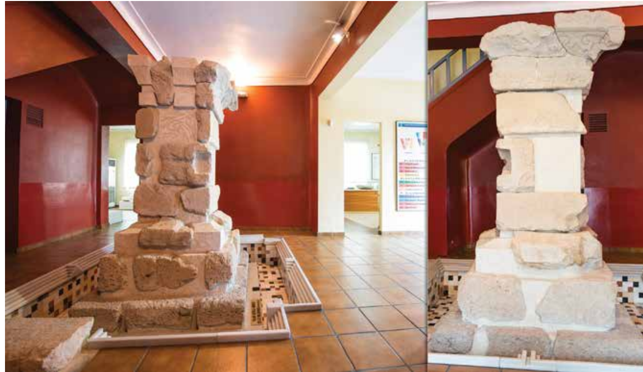
PILAR-ESTELA DE EL MEJORADO

ES De Época Ibérica destaca el pilar-estela de El Mejorado, uno de los monumentos funerarios de carácter aristocrático mejor conservado del Mundo Ibérico, y las cerámicas y el armamento de Cabezo Lucero.